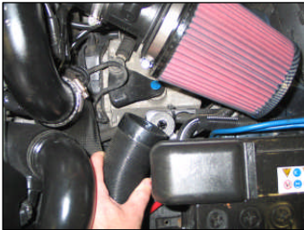
Fig. # 21